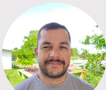
JOSÉ MARIA JR SEC. IMPRENSA E DIVULGAÇÃO